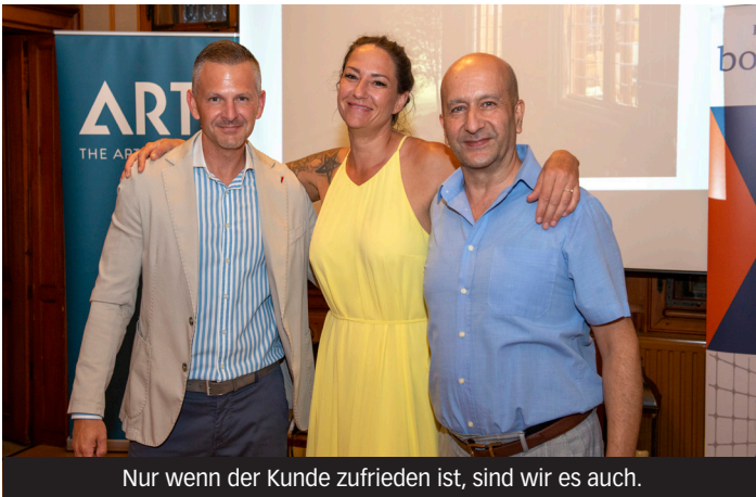
Nur wenn der Kunde zufrieden ist, sind wir es auch.