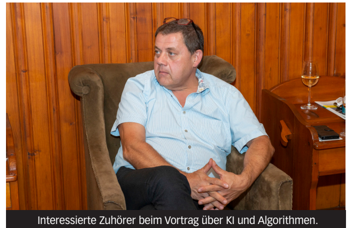
Interessierte Zuhörer beim Vortrag über KI und Algorithmen.