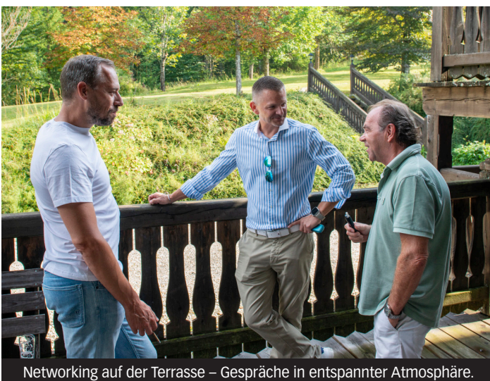
Networking auf der Terrasse – Gespräche in entspannter Atmosphäre.