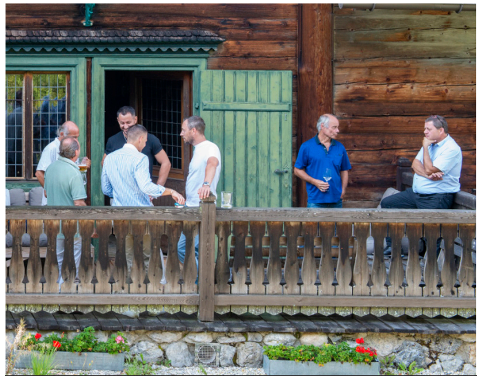
Sonne tanken und geschäftliche Beziehungen vertiefen.