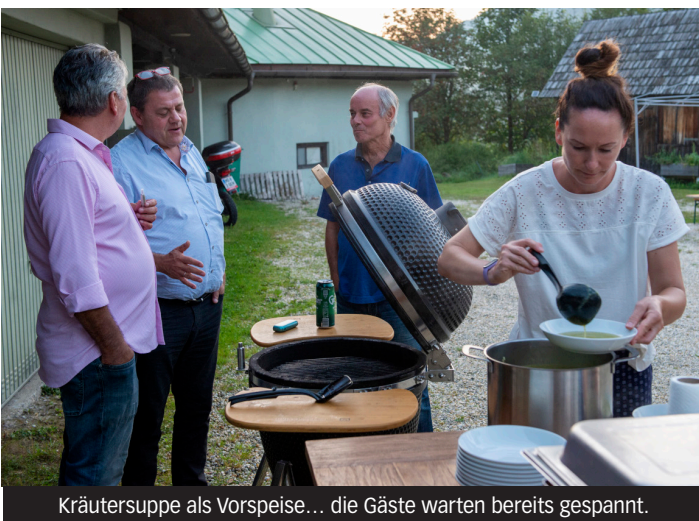
Kräutersuppe als Vorspeise... die Gäste warten bereits gespannt.