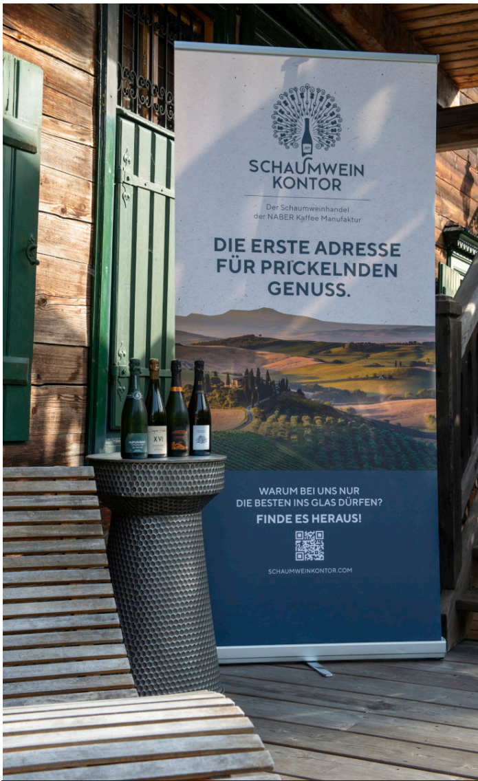
Erstklassiger Empfang in Mariazell mit sprudelndem Champagner.