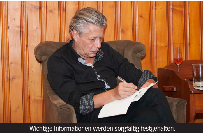
Wichtige Informationen werden sorgfältig festgehalten.