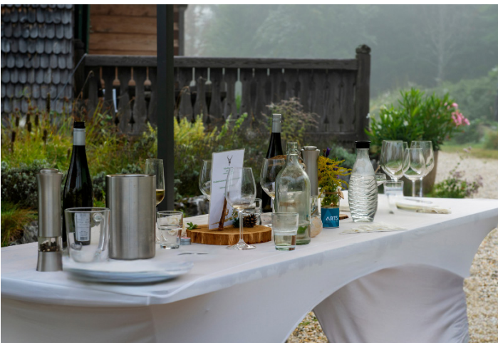
Perfekte Kulisse: Fein angerichtete Tische für ein Essen im Freien.