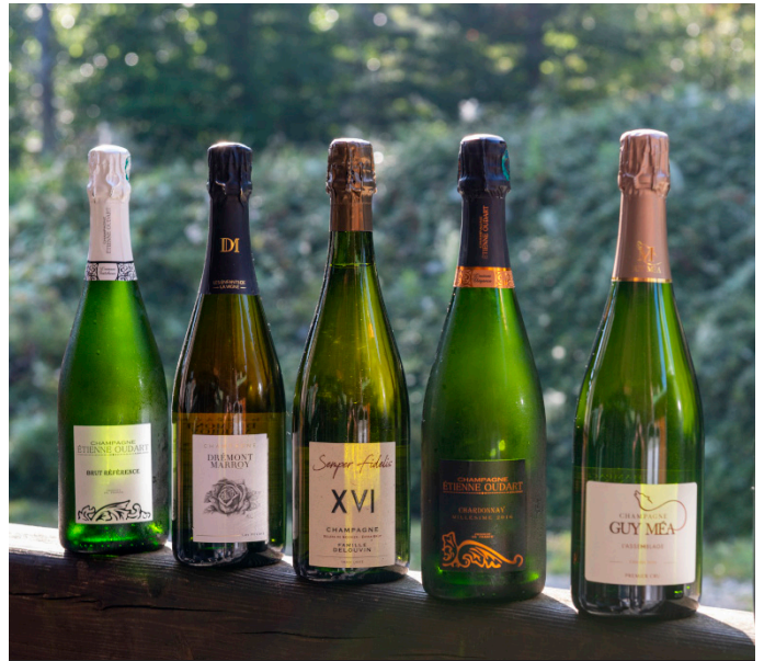
Feinste Champagner-Auswahl, sorgfältig zusammengestellt.