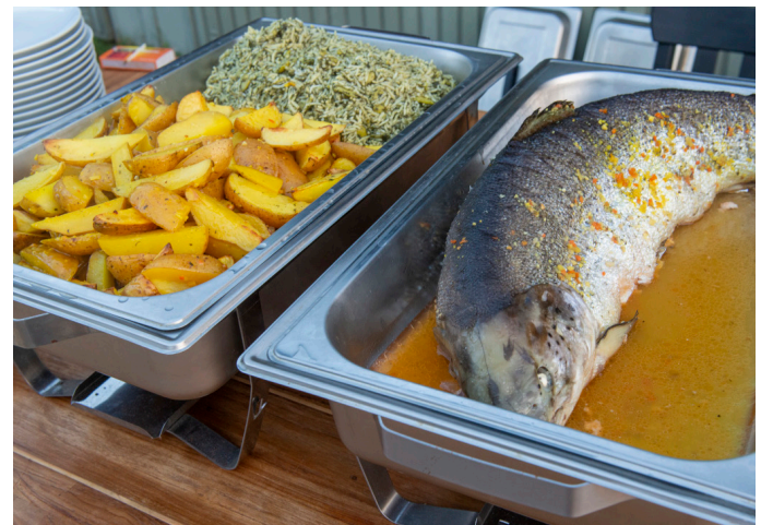
Kräuterreis und Lachs im Ganzen – eine Gaumenfreude.