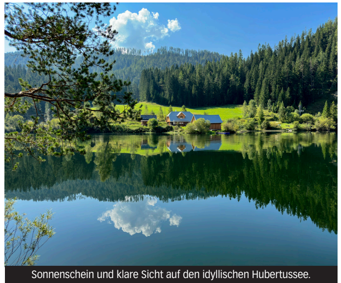
Sonnenschein und klare Sicht auf den idyllischen Hubertussee.