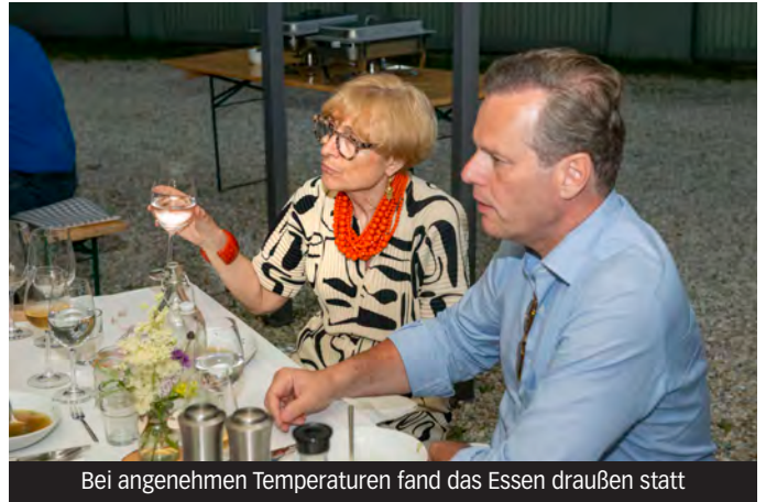
Bei angenehmen Temperaturen fand das Essen draußen statt