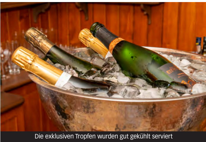
Die exklusiven Tropfen wurden gut gekühlt serviert