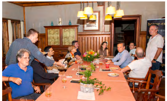
Nach dem Essen fand eine Champagnerverkostung statt