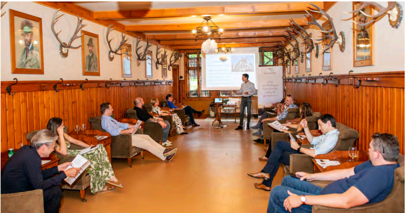
Das Thema ethische Geldanlagen stieß bei allen Teilnehmern auf großes Interesse und wurde begeistert aufgenommen