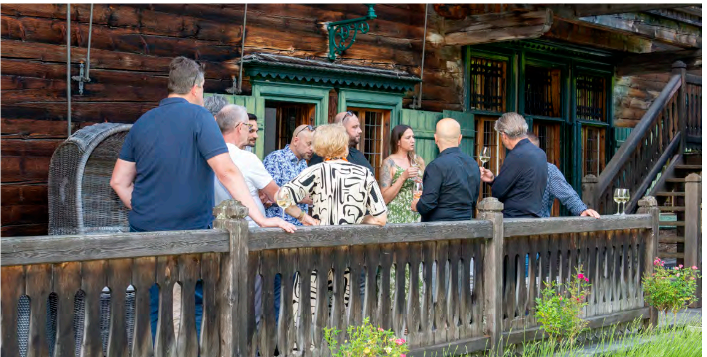
Strahlender Sonnenschein, tolle Gäste und ein Glas Champagner auf der Terrasse