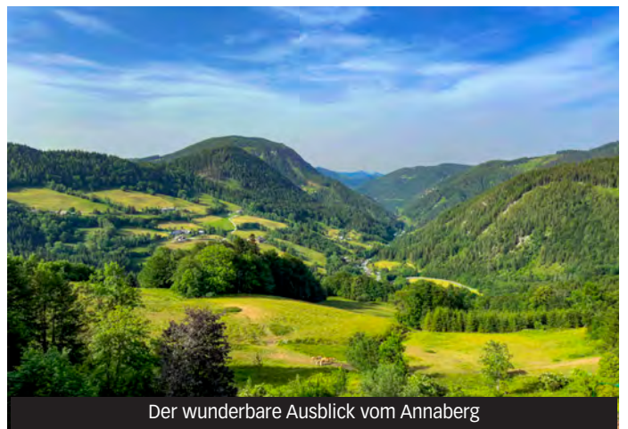
Der wunderbare Ausblick vom Annaberg