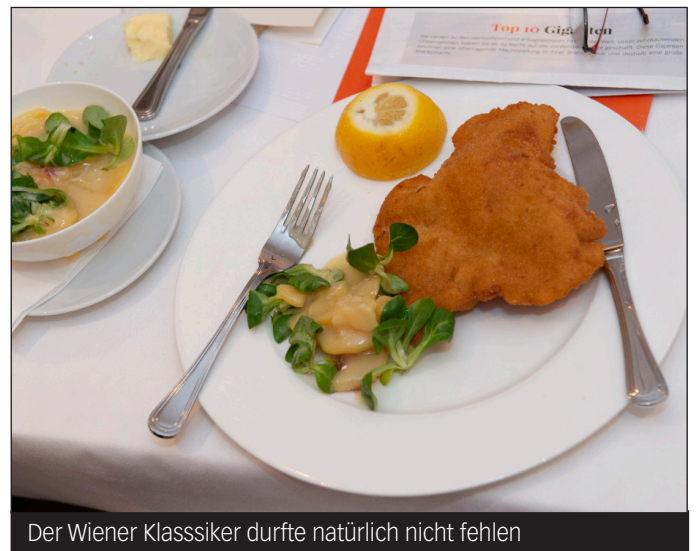
Der Wiener Klassiker durfte natürlich nicht fehlen