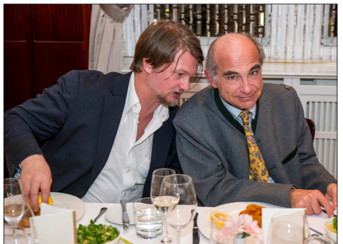
Gute Gespräche unter Fachleuten beim original Kalbsschnitzel