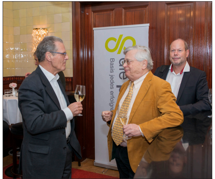
Fachlicher Austausch unter sorgfältig ausgewählten Teilnehmern