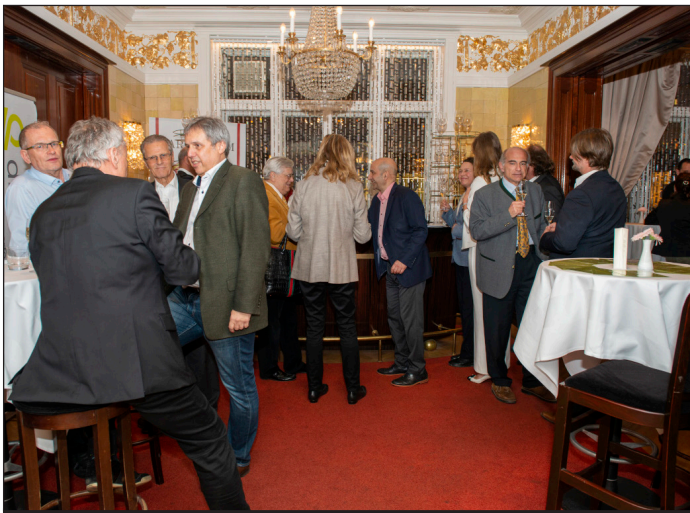
Entspannte Atmosphäre und erlesener Wein an der Bar im Bel Etage