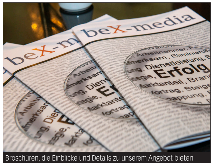
Broschüren, die Einblicke und Details zu unserem Angebot bieten