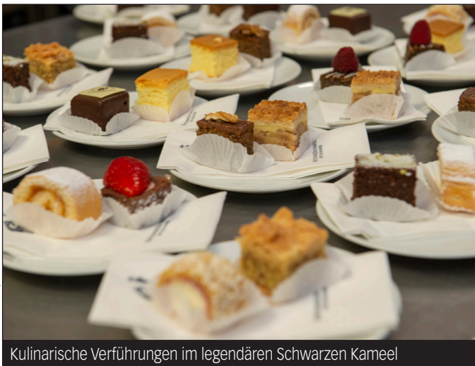
Kulinarische Verführungen im legendären Schwarzen Kameel