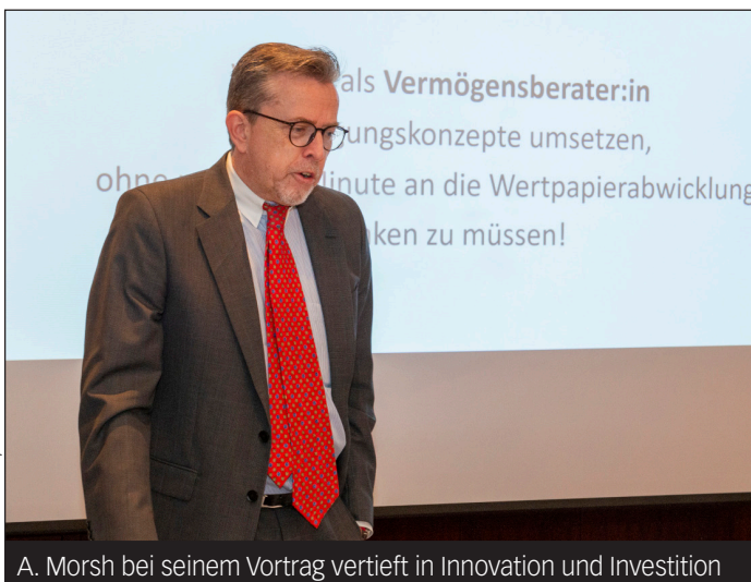
A. Morsh bei seinem Vortrag vertieft in Innovation und Investition