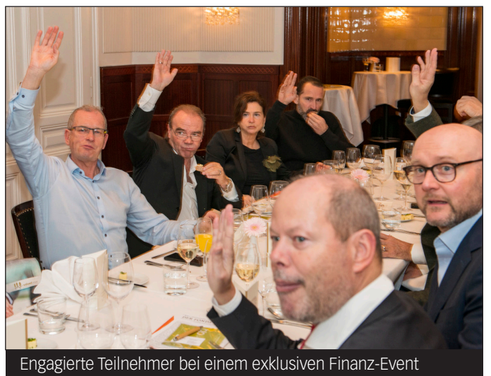
Engagierte Teilnehmer bei einem exklusiven Finanz-Event