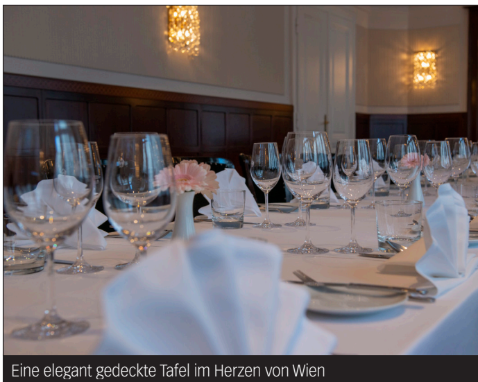
Eine elegant gedeckte Tafel im Herzen von Wien