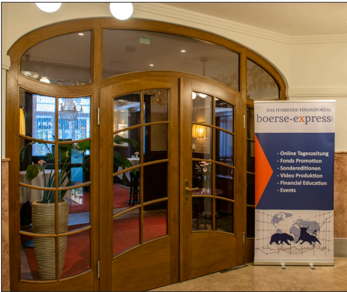
Der Eingangsbereich mit prunkvollem Charme und historischer Eleganz