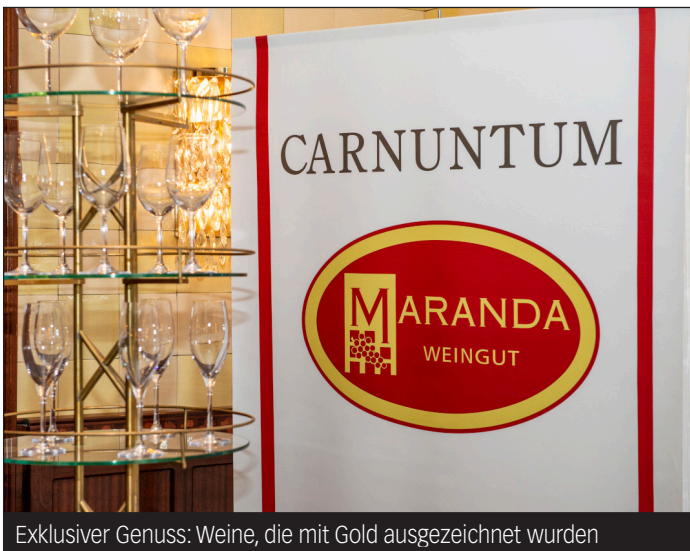
Exklusiver Genuss: Weine, die mit Gold ausgezeichnet wurden