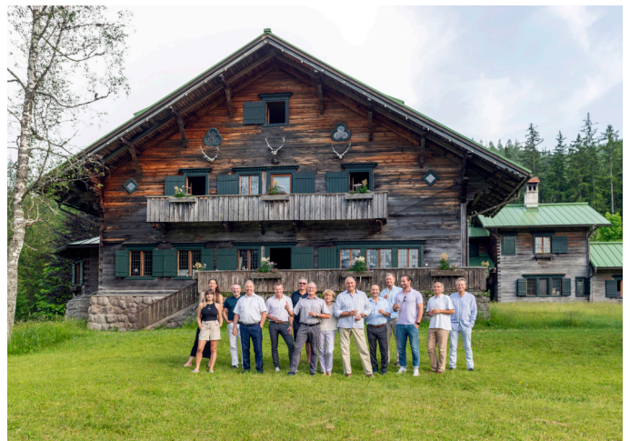
Gruppenfoto vor traumhafter Kulisse