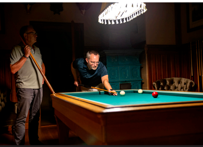
Strategieplanung bei einer Runde Karambol Billard