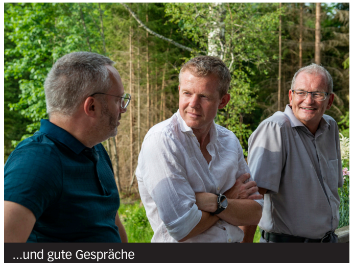
...und gute Gespräche