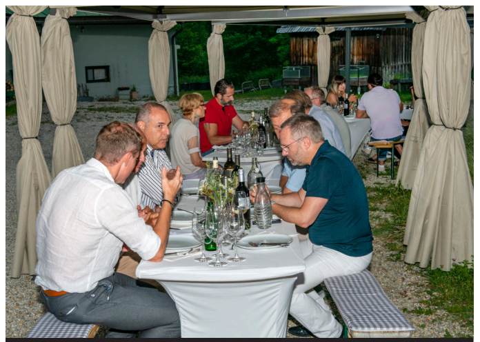
Networking nach dem Essen bei gutem Wein