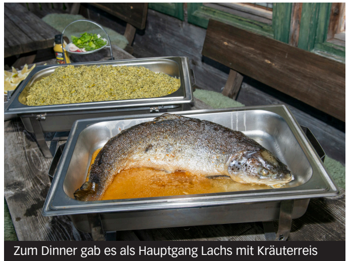
Zum Dinner gab es als Hauptgang Lachs mit Kräuterreis