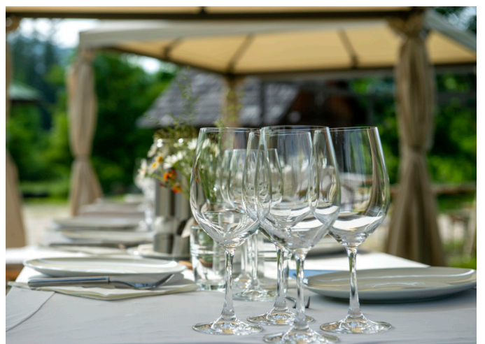
Das Wetter erlaubte Dinner unter freiem Himmel