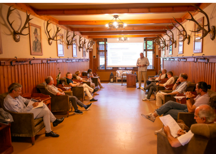
Früher trafen sich hier die Jäger...heute Finanzberater :-)