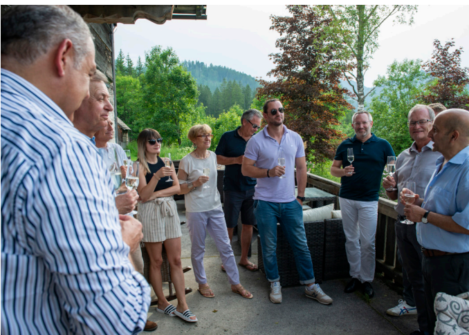
Offizielle Begrüßung mit allen Gästen bei herrlichem Wetter