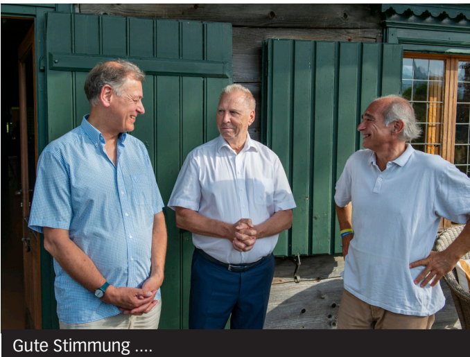
Gute Stimmung ....